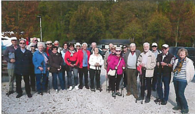
Wanderung am Nationalfeiertag

Der Pensionistenverband ist aber nicht nur an diesem Feiertag aktiv. Jeden Dienstag um 09.00 Uhr (Winterzeit) und um 08.00 Uhr (Sommerzeit) treffen sich viele Sportbegeisterte bei der Stockschützenhalle in Edt, um eine einstündige NORDIC-WALKING-RUNDE in freier Natur zu genießen.