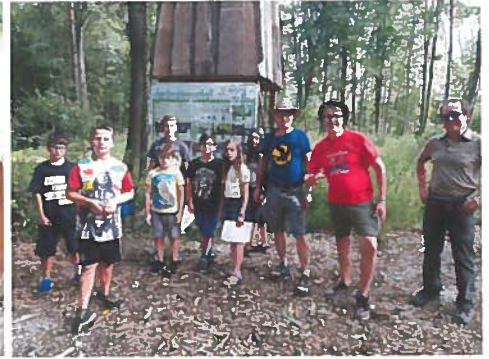
Schnitzeljagd durch Wald & Au

Ebenso wurde im Oktober an der Aktion „City Rallye“ der Roten Falken in Wels teilgenommen und für die Mitglieder der Kinderfreunde eine Nachtwächter - Wanderung in Wels organisiert.